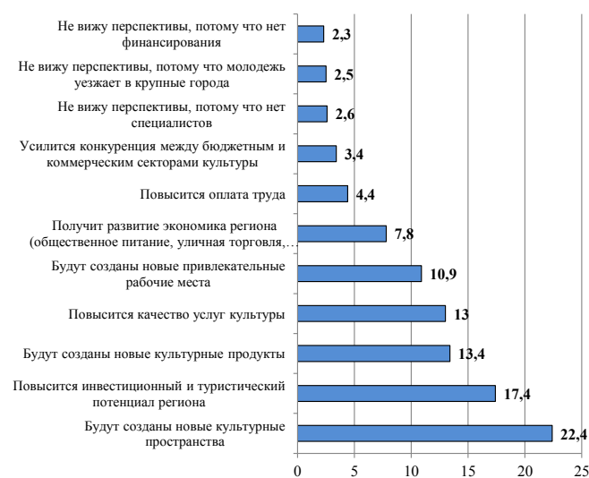
Рис. 2. «Какие перспективы принесет развитие креативных индустрий для развития сферы культуры в Вашем регионе?», в % от всей совокупности ответов