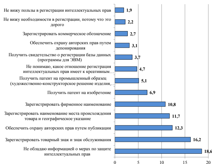
Рис. 3. «По Вашему мнению, какие меры необходимо принимать для охраны интеллектуальных прав производителям креативных продуктов/услуг?», в % от всей совокупности ответов

– практикоориентированное обучение, предполагающее, во-первых, отработку практических навыков на рабочих местах, во-вторых, разбор кейсов, наиболее релевантных