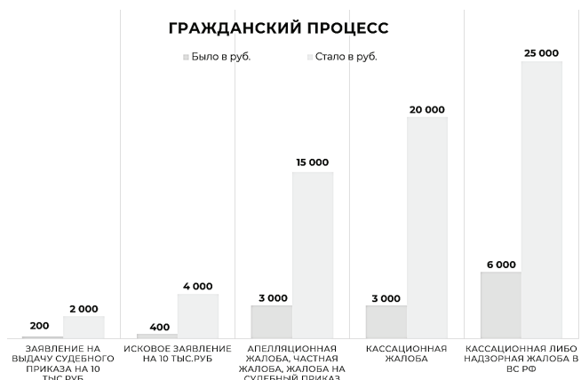
Рис. 3. Размер увеличения госпошлины при обращении в суд [5]

На основе приведенных фактов встает вопрос о необходимости предусмотреть особый механизм оплаты госпошлины или гибкое ценообразование для организаций в сфере ЖКХ, поскольку указанные суммы госпошлин лягут непомерным грузом на