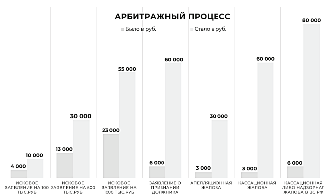
Рис. 2. Размер госпошлины [5]

ных приказов теперь нужно будет заплатить 2000 руб. вместо 200 руб. Разница просто колоссальная. К примеру, за 2023–2024 гг. ООО «Гринта» уже подано около 25 тыс. заявлений, а это почти 50 млн руб. госпошлины.