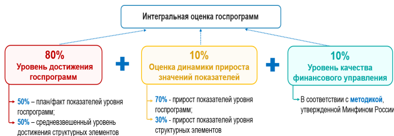
Рис. 2. Расчет интегральной оценки эффективности и хода реализации госпрограмм [5]

Достаточно низкий уровень финансового управления по госпрограммам связан с тенденцией перераспределения предусмотренных сводной бюджетной росписью средств федерального бюджета в резервный фонд Правительства в конце года для снижения доли неосво-