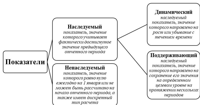
Рис. 3. Типы показателей для оценки динамики их прироста [6]