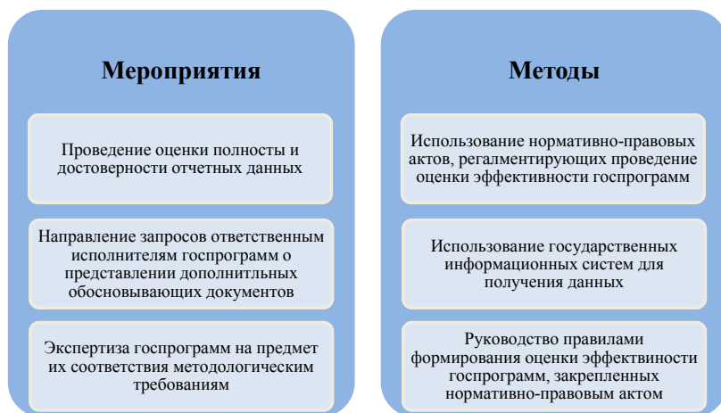
Рис. 1. Структура механизма оценки эффективности госпрограмм [3]

1) мероприятия, проводимые для получения достоверной информации о ходе реализации госпрограмм за отчетный год;