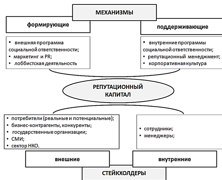
Рис. 1. Механизмы формирования репутационного капитала

Поддерживающие механизмы направлены на внутренних стейкхолдеров и включают в себя влияние на внутреннюю среду через программы внутренней корпоративной социальной ответственности (КСО), корпоративную культуру, оценку качества и репутационный аудит (рис. 1). Для демонстрации значимости отношений с сотрудниками в формировании репутации, доверия и экономических показателей эксперты «Сбера» приводят кейс-анализ компании Toshiba [10]. Отмечено, что в 2008 г. компания понесла рекордные потери 3,47 млрд долл. из-за авторитарной и агрессивной корпоративной культуры. Давление на сотрудников привело к утрате организационного доверия и, как следствие, нарушению внутренней коммуникации – существующие проблемы не обсуждались, а замалчивались. В результате компания понесла не только экономические, но и репутационные потери, сопряженные с увольнением сотрудников и последующими судебными разбирательствами.