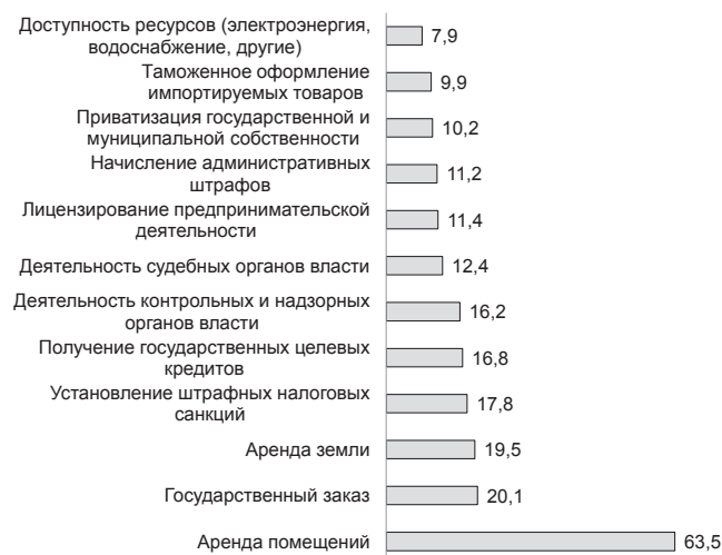
Рис. 2. Распределение ответов на вопрос о проблемах «взаимодействия» бизнеса и государства (множественный выбор, %)

Исследуя вопрос о взаимодействии молодых предпринимателей и государства, мы выделили несколько наиболее «острых» проблем (см. рис. 2). Оказалось, что из предложенных вариантов чаще всего студенты отмечают проблему – «аренда помещений» (63,5 %). Подчеркнем, что одним из основных направлений имущественной поддержки субъектов малого предпринимательства является льготная аренда государственного и муниципального имущества. Поэтому вопрос об аренде помещений имеет столь существенное значение для поддержки молодых предпринимателей.