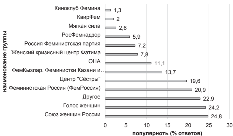
Рис. 1. Популярность феминистских социальных групп

сы распределения обязанностей при ведении домашнего хозяйства получили также высокое количество ответов. Тревожным остается тот факт, что такие позиции, как «харасмент» (35%), «абыюз» (76%), домашнее насилие (80%), насильственные традиции (45%), репродуктивное насилие (56%), – все связаны одной тематикой, а именно причинение вреда морального, физического, материального женщинам. Выходит, что в феминистском движении женщины ищут защиты для себя фактически уже в существующей реальности, в которой они живут. Однако при конкретизации и изменении формулировки этого же вопроса полученные ответы дают совершенно другую картину.