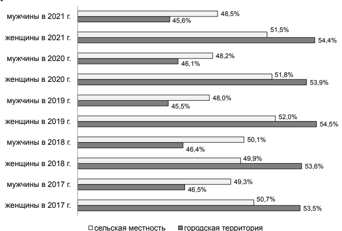
Рис. 2. Распределение прибывших в РТ по полу и типу территории за 2017-2021 гг.