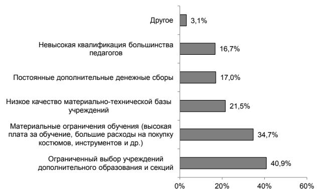
Рис. 3. Проблемы дополнительного образования

Проблемы среднего профессионального образования можно условно разделить на группы. В первую по актуальности входят низкая квалификация большинства преподавателей/мастеров и качество материально-технической базы (отсутствие современной учебно-лабораторной базы, отсутствие со-