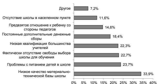
Рис. 2. Проблемы средних общеобразовательных школ

респонденты акцентировали внимание на низкой квалификации большинства учителей, а в Дрожжановском и Нурлатском на низком качестве материально-технической базы школы. С проблемами в питании детей в школе чаще сталкиваются родители Арского, а с предвзятым отношением к ребенку со стороны педагогов – родители Ютазинского и Сармановского районов. На постоянные дополнительные денежные сборы больше жалоб было от населения Казани, Камско-Устьинского и Лениногорского районов.