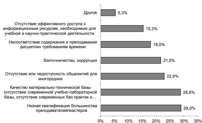
Рис. 4. Проблемы среднего профессионального образования

Материальные ограничения обучения в виде высокой оплаты являются основным источником недовольства населения относительно высшего образования (39,4 %). Четверть опрошенных жалуется на отсутствие или недоступность общежитий для иногородних (25,6 %), а одна пятая часть опрошенных на несоответствие содержания и преподавания дисциплин требованиям времени, а также на взяточничество, коррупцию (22 и 0,5 %). Обвиняют преподавателей вуза в низкой квалификации 19,1 % населения. Качество материально-технической базы (отсутствие современной учебно-лабораторной базы, современных баз практик и пр.) не устраивает 14,7 % респондентов. На отсутствие эффективного доступа к информационным ресурсам, необходимым для учебной и научно-практической деятельности указал каждый десятый респондент.