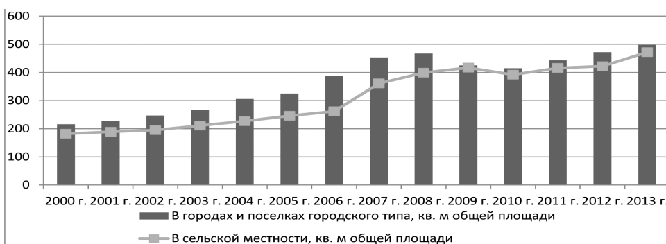
Рис. 1. Ввод в действие жилых домов в расчете на 1000 чел. населения [3]