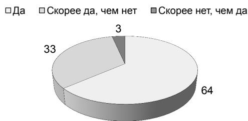
Рис. 1. Мнение респондентов об актуальности программы «Цифровая социология», в %

Опрос показал, что большинство респондентов (в совокупности 96,6 %) считают образовательную программу «Цифровая социология» актуальной (рис. 1).