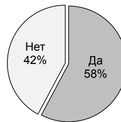
Рис. 2. Распределение ответов на вопрос: «Занимаетесь ли Вы любительским спортом?»

Те, кто сам занимается любительским спортом, в большей степени признают, что он является активным агентом социализации для населения. Среди них немного преобладают мужчины среднего и бо-