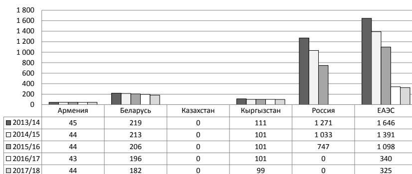
Рис. 1. Число образовательных организаций начального профессионального образования (на начало учебного года; ед.) на пространстве ЕАЭС [3]

Казахстан на протяжении многих лет является бесспорным лидером по числу студентов, обучающихся в российских вузах. В 2015-2016 академи-