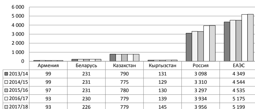
Рис. 2. Число образовательных организаций среднего профессионального образования (на начало учебного года; ед.) на пространстве ЕАЭС [3]

ческом году в России было 66 821 студент из этой страны. В 2016/2017 учебном году зачислено 67 403 студента [4]. Можно проследить тенденцию роста по количеству казахских студентов, но в 2017/2018 году приехало 65 700 обучающихся, что на 2 % меньше, чем по статистике прошлого года. На втором месте – Беларусь (где в 2017/2018 учебном году прошло обучение 10 792 студента), а замыкает тройку лидеров студенты из Кыргызстана, который отправил 7 247 студентов на обучение в российские вузы за прошедший год.