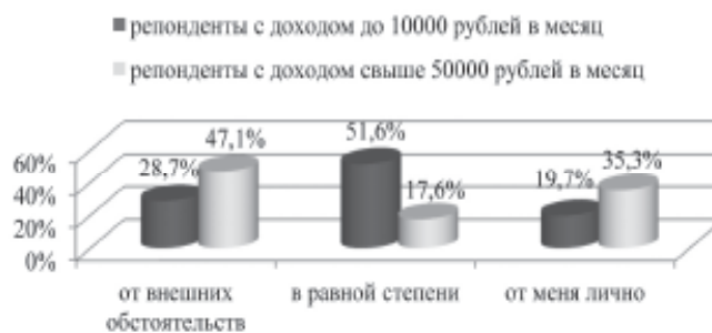
Рис. 3. Оценка факторов, определяющих материальное положение респондентов