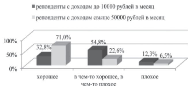
Рис. 2. Оценка времени для совершения крупных покупок

Относительно прогнозов экономического и политического развития страны картина выглядит следующим образом. В экономике респонденты с высоким уровнем дохода ожидают некоторого ухудшения (41,2 к 32,8 % у низкодоходной группы). Последние, в свою очередь, надеются на улучшение в экономике (53,8 % к 29,4 %). Однако среди респондентов с высоким доходом больше тех, кто верит в значительное улучшение экономической ситуации (23,5 к 9,6 % опрошенных). Доля респондентов,