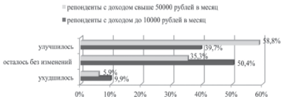
Рис. 1. Оценка материального положения своей семьи

Относительно материального положения россиян анализируемые группы проявили единодушие. В обеих лидировало мнение, что оно останется без изменений (56,9 у низкодоходной и 52,9 % у высокодоходной группы). При этом по общему массиву в два раза меньше оптимистов (25,4 и 29,4 % соот-