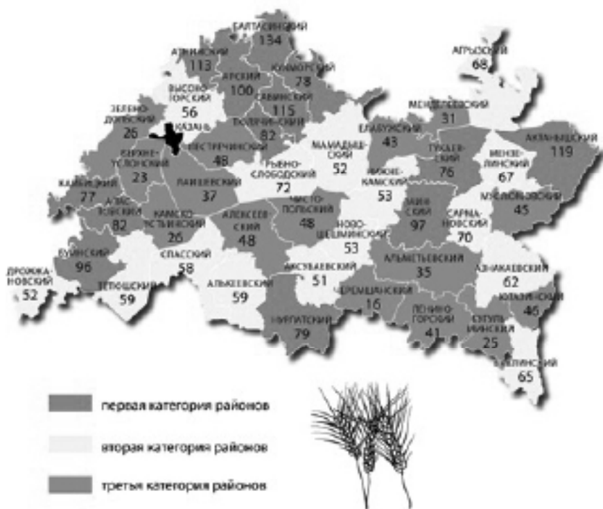
Рис. 4. Рейтинг муниципальных образований по эффективному ведению растениеводства за 2014 г. [7]

5. Использовать электронные площадки реализации продукции.