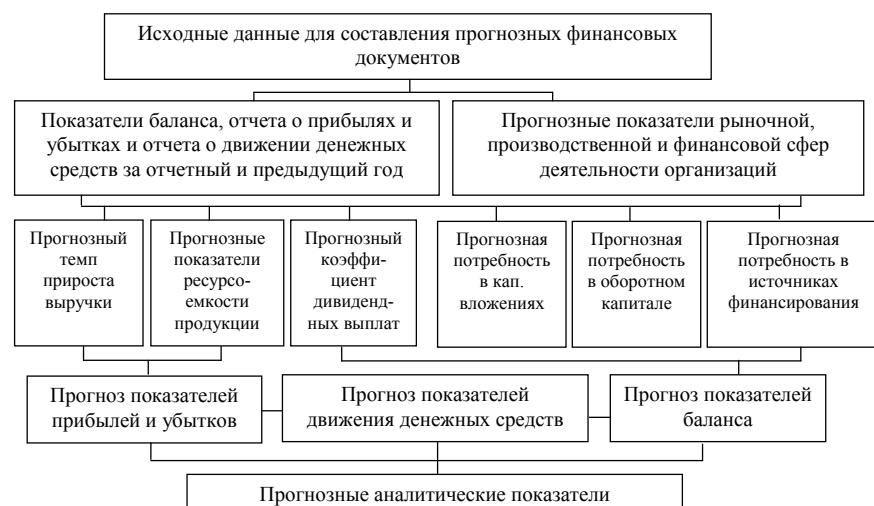
Рис. 3. Элементы проведения комплексной прогнозной оценки организации