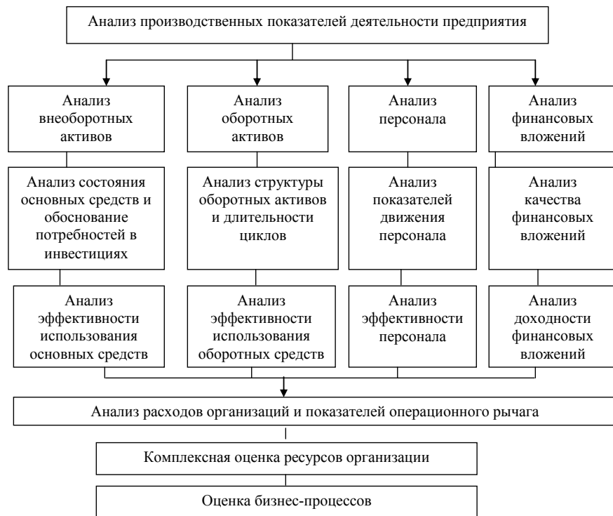
Рис. 2. Блок-схема анализа производственных показателей деятельности организации

Исследователи Д.А. Ендовицкий и Л.Л. Еромолович методику экономического возводят на уровень корпоративного стандарта, в составе: «... его целей и задач; совокупности изучаемых показателей, факторов их изменения; схемы взаимосвязей показателей; последовательности, периодичности и сроков