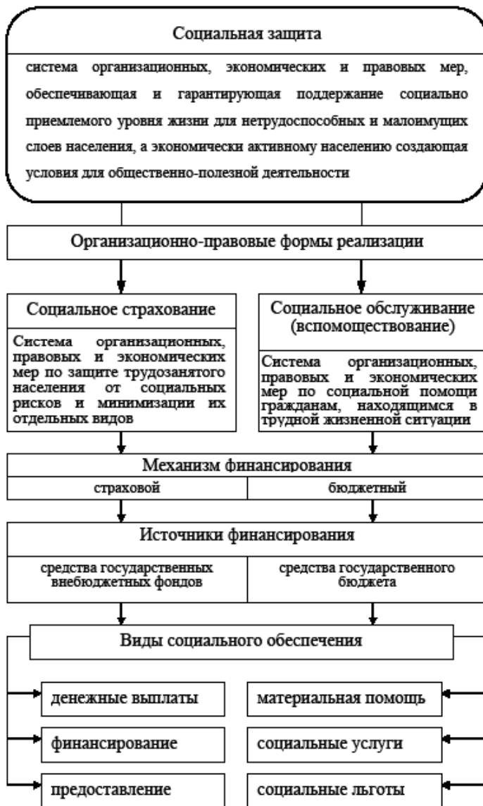
Рис. 1. Элементы социальной защиты населения

социальной страховой защиты являются государственные социальные внебюджетные фонды РФ. Особое место в системе обеспечения социальной защиты занятого населения занимает Фонд социального страхования РФ (ФСС РФ). ФСС РФ в настоящее время управляет средствами обязательного социального страхования на случай временной нетрудоспособности и в связи с материнством, а также обязательного социального страхования от несчастных случаев на производстве и профессиональных заболеваний. Таким образом, функционирование этого фонда исключительно ориентировано на занятое население.