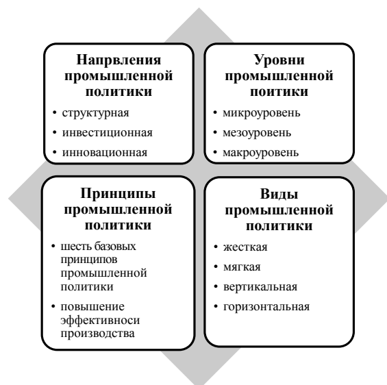
Рис. 1. Структура промышленной политики

вития новых отраслей промышленности в рамках инновационного развития. При этом существует потребность координирования развития различных отраслей, предприятий, формирования направленности и значимости инвестиционных потоков, формирования новых технологических цепочек и повышения конкурентоспособности промышленности в условиях глобальной конкуренции. Также необходимо учитывать значимость координирующей функции промышленной политики, а именно сочетания финансирования ряда процессов промышленного развития или самих промышленных предприятий из государственного бюджета с необходимостью налаживания инвестиционного потока в рамках промышленных предприятий при задействовании собственных внутренних источников развития.