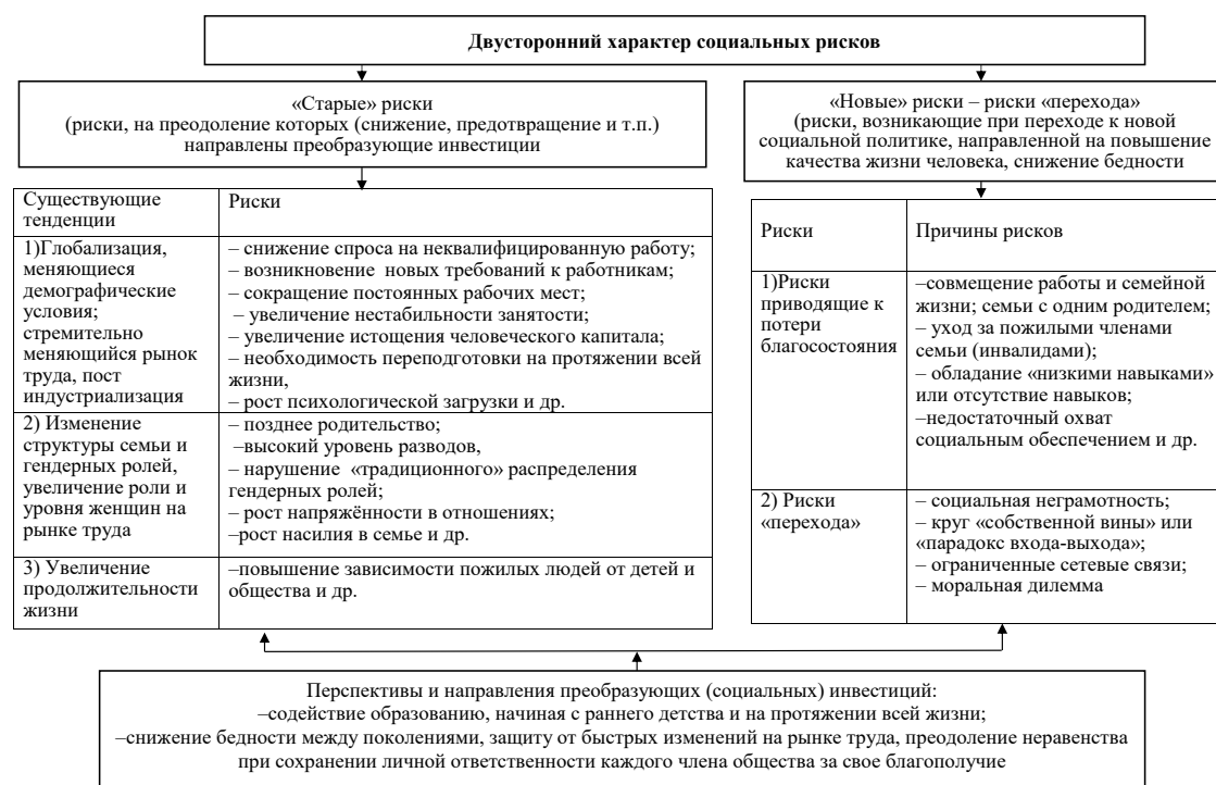
Рис. 2. Двусторонний характер социальных рисков

Необходимость использования институционального подхода при исследовании преобразующих инвестиций