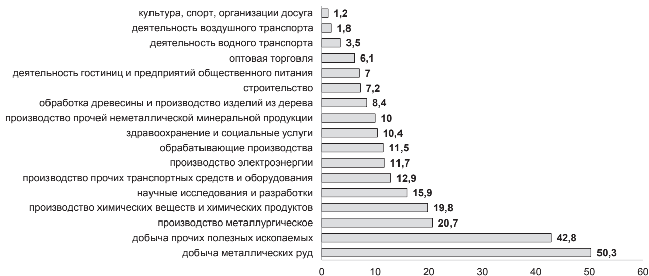
Рис. 2. Рентабельность проданных товаров, продукции, работ, услуг [4] при средневзвешенной ставке по долгосрочным займам – 10,9 %, для краткосрочных (до одного года) – 12,4 % [5]

Таким образом, назрела необходимость в обеспечении долгосрочного льготного кредитования для малого и среднего туристического бизнеса с процентными ставками, которые позволяют окупать инвестиции в объекты туристско-рекреационного комплекса.