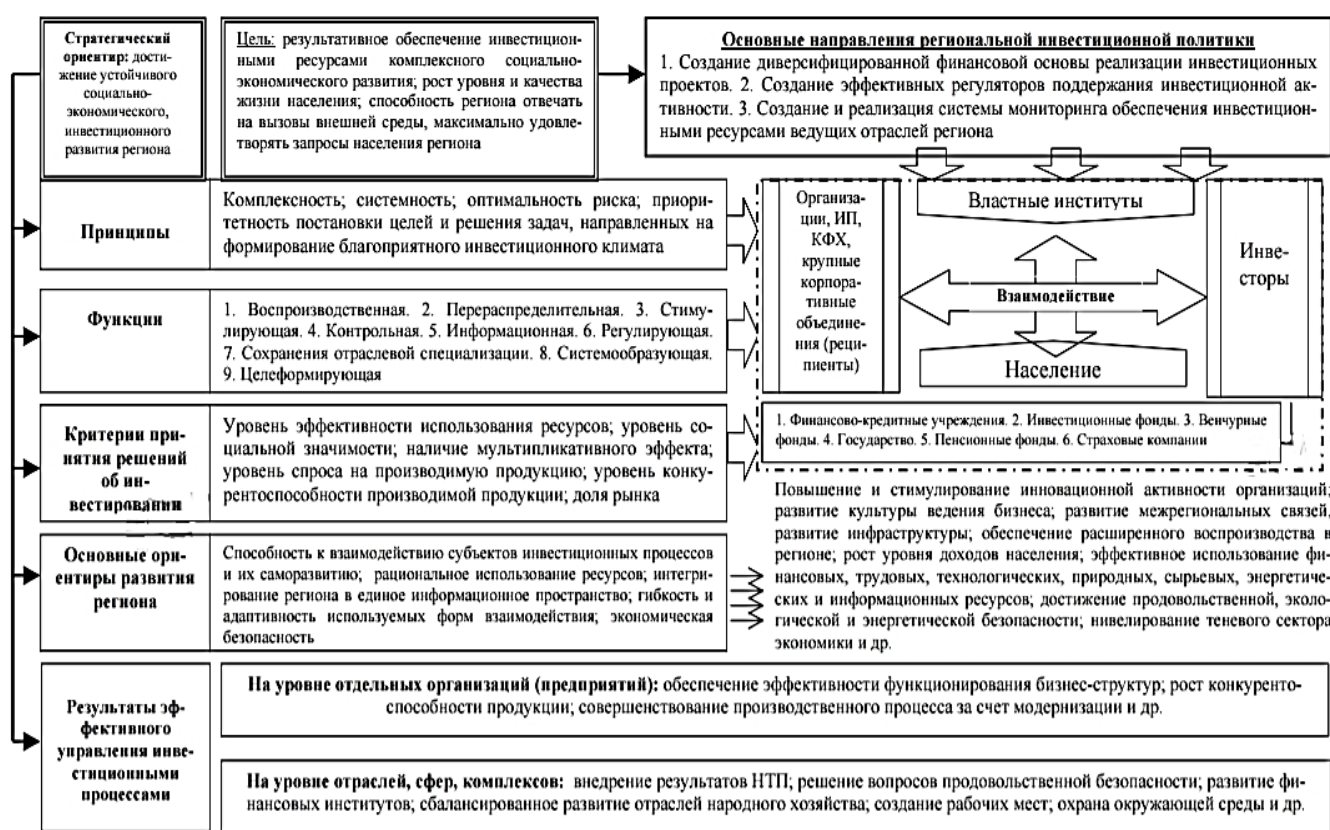
Рис. 1. Система инвестиционной политики региона [2]

рит о том, что количество вкладываемых средств увеличилось. Область обладает возможностью инвестировать в себя, чем провоцирует развитие экономической и социальной сфер. Отметим то, что по данным Федеральной службы государственной статистики, в 2019 г. регион занял 33 место из 85 субъектов по количеству вложенных инвестиций на душу населения.