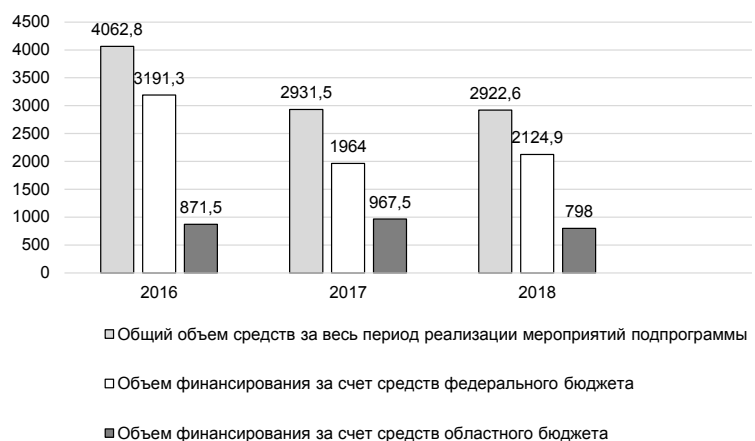
Рис. 1. Объемы финансирования программы «Оказание содействия добровольному переселению в Иркутскую область соотечественников, проживающих за рубежом» за 2016-2018 гг., тыс. руб.

Согласно публичным отчетным данным за 2014-2018 гг. количество заявлений от соотечественников