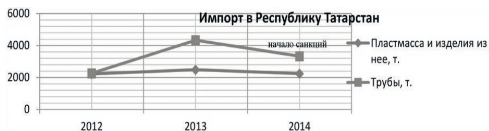
Рис. 2. Импорт отдельных видов конкурирующей к НГХК РТ продукции по 2014 г.