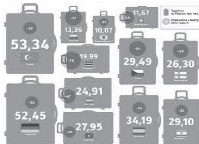
Рис. 1. Как снизилось количество российских туристов в марте 2015 г. [1]

Финансовое обеспечение – это гарантия каждому туристу возврата денежных средств, внесенных в счет договора о реализации туристского продукта