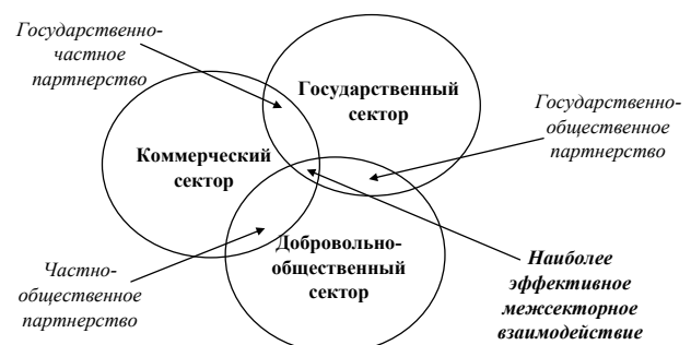
Рис. 1. Система межсекторного взаимодействия

Однако последний вариант возможен лишь при соблюдении ряда условий как со стороны политической власти, так и бизнес-сообщества [1, с. 92]. Во-первых, бизнес-структуры должны отказаться от участия в политических процессах региона или страны и сосредоточить свое внимание исключительно на решении экономических вопросов. Во-вторых, политическое руководство региона, в котором реализуется межсекторное взаимодействие, должно быть не связано обязательствами с бизнес-сообществом. По-