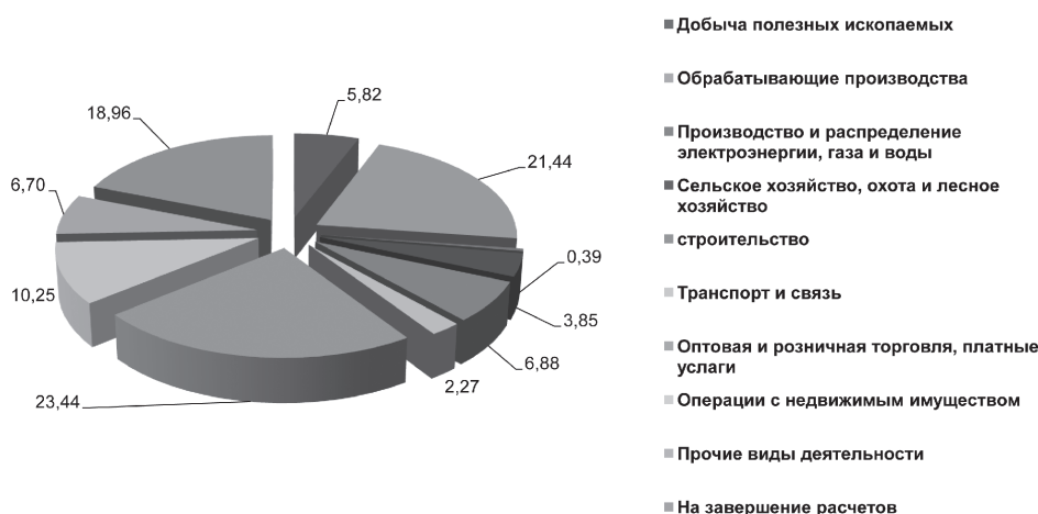
Рис 1. Структура предоставленных новых кредитов экономике РТ по видам экономической деятельности за 1 полугодие 2012 г. (в %) [1]

составил 3,2 %. В абсолютном выражении данное снижение соответствовало 5,4 млрд. руб. Однако в первой половине 2012 г. снова наметился рост просроченной задолженности по кредитам реального сектора экономики.