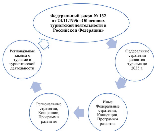
Рис. 2. Предлагаемая иерархия понятийного аппарата сферы туризма в нормативно-правовых актах