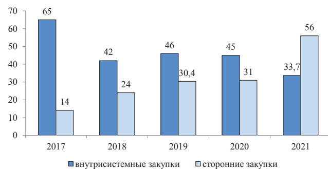
Рис. 1. Динамика внутрисистемных и сторонних закупок продовольствия в структуре закупочной деятельности УИС в 2017–2021 гг., %

Как видим, в 2021 г. урожайность картофеля в сельхозугодьях УИС по Рязанской области была в 2,5 раза меньше, чем в промышленном секторе области. Все это указывает на низкую эффективность организации сельскохозяйственного производства в аграрном секторе УИС, которая в свою очередь обусловлена недостаточным уровнем финансирования аграрного сектора. Как следствие, низкая фондовооруженность, нехватка квалифицированных специалистов, способных организовать аграрное производство на современном высокотехнологичном уровне, отсутствие специализированных складских помещений для хранения произведенной продукции. Все это, безусловно, отражается на эффективности аграрного сектора