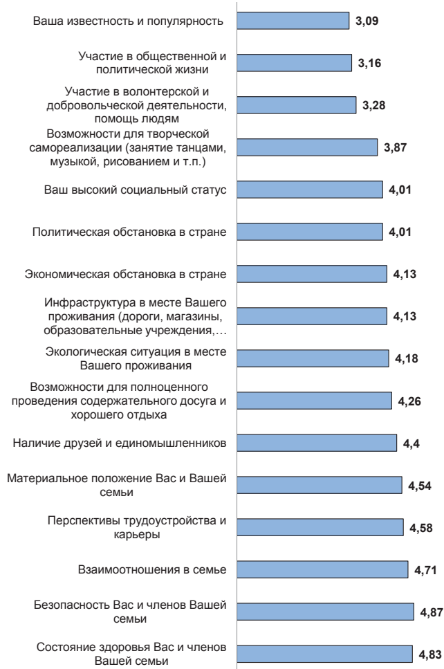
Рис. 3. Оценка важности сторон жизни респондента (регионы СФО)

Исследование ценностей молодежи представляет собой актуальную проблематику для социологии. Ценности представляют собой динамичную систему, меняющуюся под влиянием разного рода обстоятельств. В связи с этим важно как формировать систему ценностей молодых россиян, так и постоянно выявлять состояние ценностной картины мира. При-