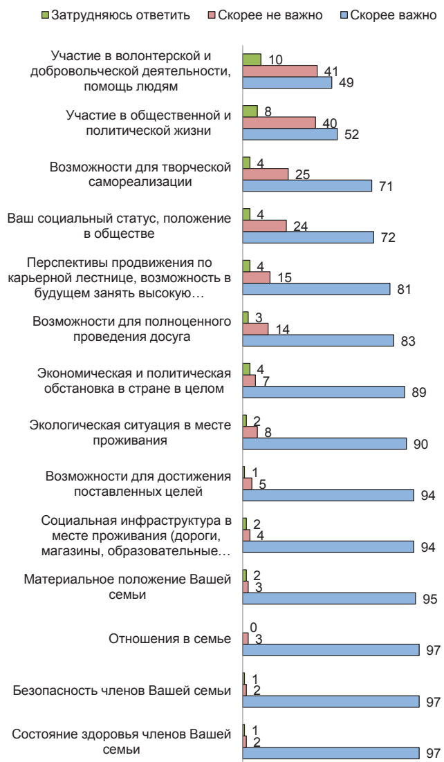
Рис. 2. Оценка важности сторон жизни респондента (результаты ВЦИОМ), %

вокупность составили студенты первого курса нескольких регионов СФО – Новосибирской области, Алтайского края, Иркутской области.