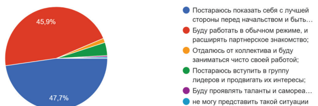
Рис. 2. Результат социологического опроса по выбору приоритета в заданной ситуации