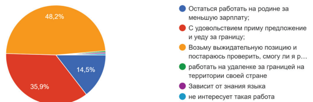
Рис. 1. Результат социологического опроса по выбору приоритета в заданной ситуации