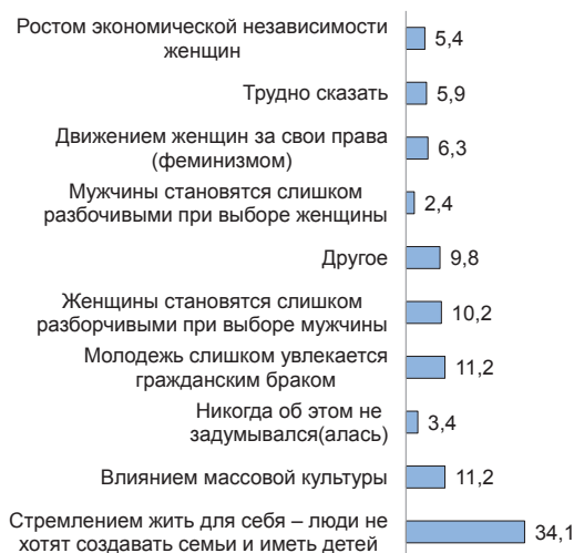
Рис. 5. Сегодня иногда говорят о кризисе института семьи. Как Вы думаете, чем может быть вызван этот кризис?, чел. в %

ся в том, что респонденты, признавая «стремление жить для себя» в качестве ключевой причины кризиса института семьи, одновременно выбирают приоритетом в жизни «свободу, независимость, возможность заниматься тем, чем хочется» , а также «работу, включая построение профессиональной карьеры» (рис. 5).