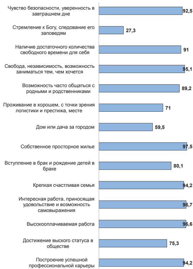
Рис. 1. Ценностные установки студентов, чел. в %

Во-первых, респонденты достаточно высоко ставят ценность семьи в общей иерархии жизненных целей, при этом не связывая ее благополучие напрямую с официально оформленными отношениями и рождением детей. В целом стоит отметить преобладание у респондентов целерациональных смыслов восприятия семьи как зарегистрированного брака над ценностными. Так, при ответе на вопрос о том, какие факторы респонденты считают значимыми для регистрации брака, большинство отметили, что «зарегистрированный брак упрощает процесс взаимодействия супругов друг с другом и государством по формальным вопросам» (69,5 %), а также что «приобретение жилья, автомобиля и других дорогостоящих вещей в браке гарантирует супругам равные права на них» (57,8 %). Также высокое значение по сравнению с другими показал вариант ответа «дети должны рождаться в официальном браке» (64,7 %), однако в данной ситуации его невозможно отнести к определенному типу поведения без дополнительных уточнений. Наименьшее коли-