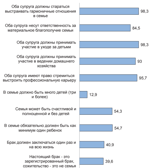
Рис. 4. Оцените, пожалуйста, степень согласия со следующими суждениями, касающимися семейной жизни, чел. в %

Также представляют особый интерес ответы респондентов на вопрос о причинах кризиса института семьи. Так, подавляющее большинство опрошенных ответили, что «стремление жить для себя, когда люди не хотят создавать семьи и иметь детей», является основной причиной снижения потребности создания данного социального института как гендерно-ролевой модели жизненного уклада. Получается неоднозначная ситуация, заключающая-