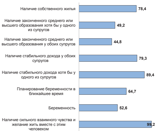
Рис. 3. Оцените, пожалуйста, значимость приведенных условий при принятии решения о создании семьи, чел. в %

ственно на достижение успехов в трудовой (профессиональной) сфере.