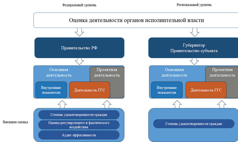
Рис. 2. Система оценки эффективности деятельности органов исполнительной власти на федеральном и региональном уровнях

в трудности количественного определения плановых показателей, таких как создание конкретного количества НПА или количества закрытых обращений граждан (данные метрики должны быть реализованы с глубоким анализом качественных характеристик, таких как процент закрытых обращений и т.д.), во-вторых оценка производится постфактум, после завершения оцениваемого периода, что делает невозможным максимальное нивелирование возникающих проблемных ситуаций. Таким же мнением обладает и В.А. Гуляев, в своей работе предложивший методику СКОУ (система комплексной оценки управления) [16, с. 1], которая основывается на формировании правильной системы мотивации и отслеживании данного показателя у служащих. Преимуществами данной системы является еженедельная оценка поставленных и выполненных задач с учетом динамических рядов, позволяющих в долгосрочном временном периоде оценить падение или повышение мотивации, следовательно, и работоспособности сотрудника. Но полный отказ от модели KPI может послужить неблагоприятным фактором отсутствия формирования четких плановых значений, требующих приложения усилий для достижения. Исключительно грамотная комбинация качественных, количественных, мотивационных показателей позволит сформировать достойный инструмент в руках органов власти.