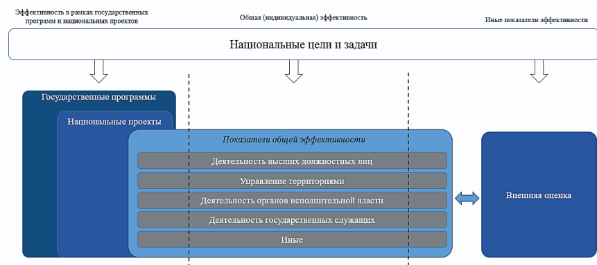
Рис. 1. Краткая схема системы определения эффективности государственного управления

Важным дополнением в данном случае является то, что существует и отличная от участия в государственных программах и национальных проектах