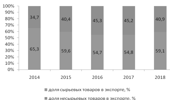
Рис. 2. Структура экспорта РФ, %

– отсутствуют эффективные цели и задачи в работе механизмов и институтов развития экспорта и