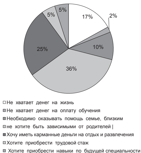
Рис. 3. Основные причины работы во время учебы

ния (казанцы – иногородние). Так, среди студентов, ответивших, что они совмещают работу и учебу, окончивших казанские школы (обычные и специализированные) было 47 %, выпускников школ других населенных пунктов Республики Татарстан – 39 %, остальные работающие студенты приехали из других регионов Российской Федерации.