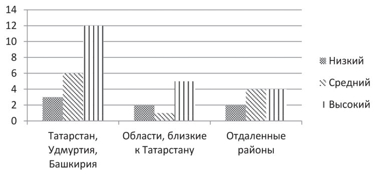
Рис. 3. Уровень рефлексии имамов в зависимости от района проживания

3. Для соотнесения эмпирических данных по районам проживания, нами были объединены места проживания студентов-имамов в три группы: 1) Татарстан, Удмуртия, Башкирия; 2) Области, близкие к Татарстану, куда вошли Киров, Нижний Новгород, Новокузнецк, Самара, Екатеринбург, Ульяновск; 3) Отдаленные области: Пермский край, Челябинск, Минск, Омск, Якутия. В результате проведения соотнесения района проживания опрошенных и его возможного влияния на уровень рефлексии имамов обнаружено, что наиболее «высокорелексивными районами» являются Татарстан, Удмуртия, Башкирия, по мере отдаления от которых уровень рефлексии религиозных деятелей заметно снижает-