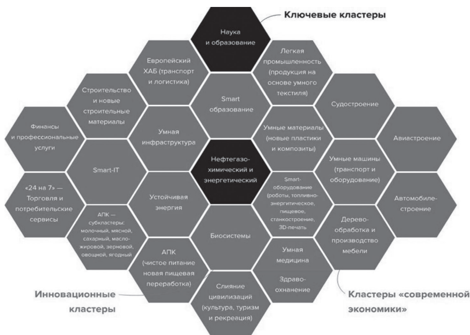
Рис. 2. Приоритетные направления для инвестирования Республики Татарстан

вания Стратегии являются создание новейшей эффективной экономики, которая базируется на высокотехнологичных секторах экономики, знаниях и развитии инновационной деятельности.