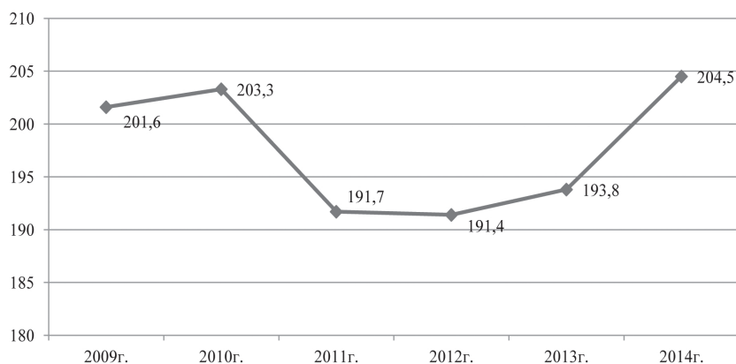
Рис. 3. Число используемых передовых технологий в РФ (в тыс. ед.)

На настоящий момент Россия еще обладает собственными научными школами в таких сферах, как космическое производство, ядерная энергетика, спецхимия, биотехнология и некоторых других. Однако, разработки, осуществляемые по данным направлениям, находят, как правило, применение не на национальном, а на мировом рынке. Так, по оценкам специалистов, большая часть перспективных фармацевтических продуктов, разрабатываемых в России, патентуется на зарубежных рынках