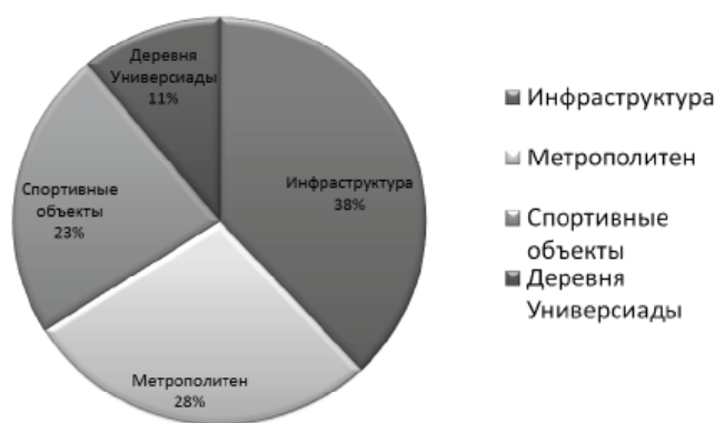
Рис. 1. Распределение бюджета Универсиады 2013 г. по направлениям строительства, %

Напрашивается вопрос: «Насколько объекты Универсиады будут востребованы после ее проведения? Не окажутся ли они “мертворожденными”,