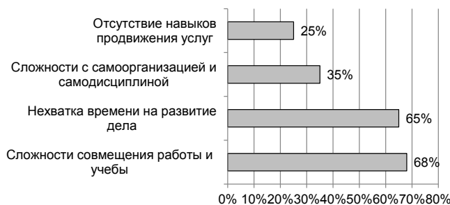
Рис. 3. Основные проблемы реализации трудовой деятельности в качестве самозанятого, % (множественные ответы)

В рамках авторского социологического опроса также были обозначены основные проблемы, с которыми сталкивается студенческая молодежь при реализации трудовой деятельности в качестве самозанятого: сложности совмещения работы и учебы – 68 %; нехватка времени на развитие дела – 65 %; сложности с самоорганизацией и самодисциплиной – 35 %; недостаточность правовых знаний в области предпринимательской деятельности самозанятых – 33 %; отсутствие навыков продвижения услуг – 25 % (см. рис. 3).