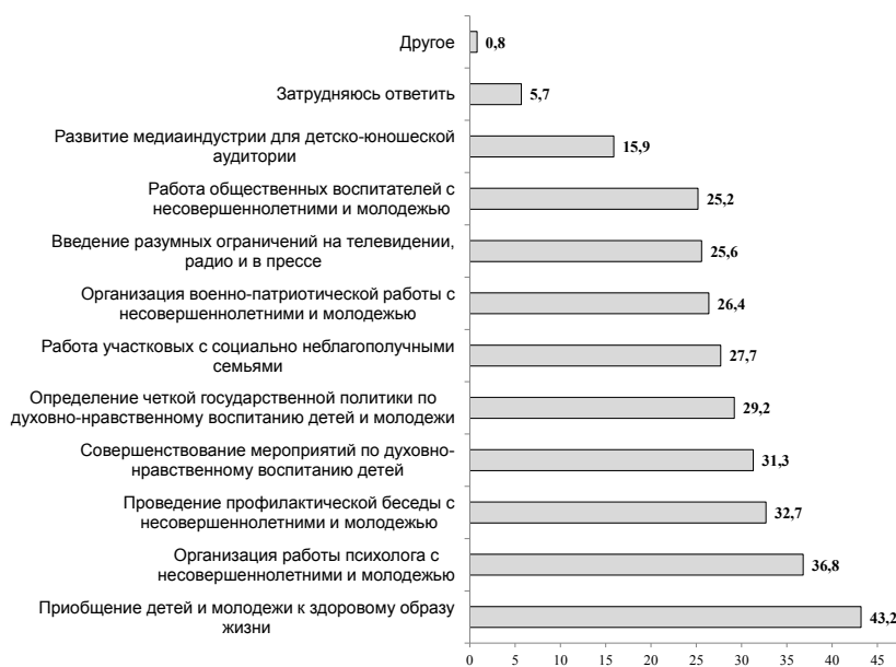
Рис. 1. Меры по предотвращению правонарушений молодежи

Для оценки необходимости профилактической работы по решению проблемы алкоголизма респондентам был задан следующий вопрос: «Как Вы считаете, следует ли в нашей стране предпринимать меры по профилактике алкоголизма среди молодежи или в этом нет необходимости?» Вариант «да, следует» выбрали 48,6 % опрошенных. Соотношение вариантов «скорее да, чем нет» и «скорее нет, чем да» составило 32,7 к 9,4 % соответственно. Не видят необходимости в профилактической работе лишь 3,8 % респондентов, 5,5 % участников опроса затруднились с ответом.