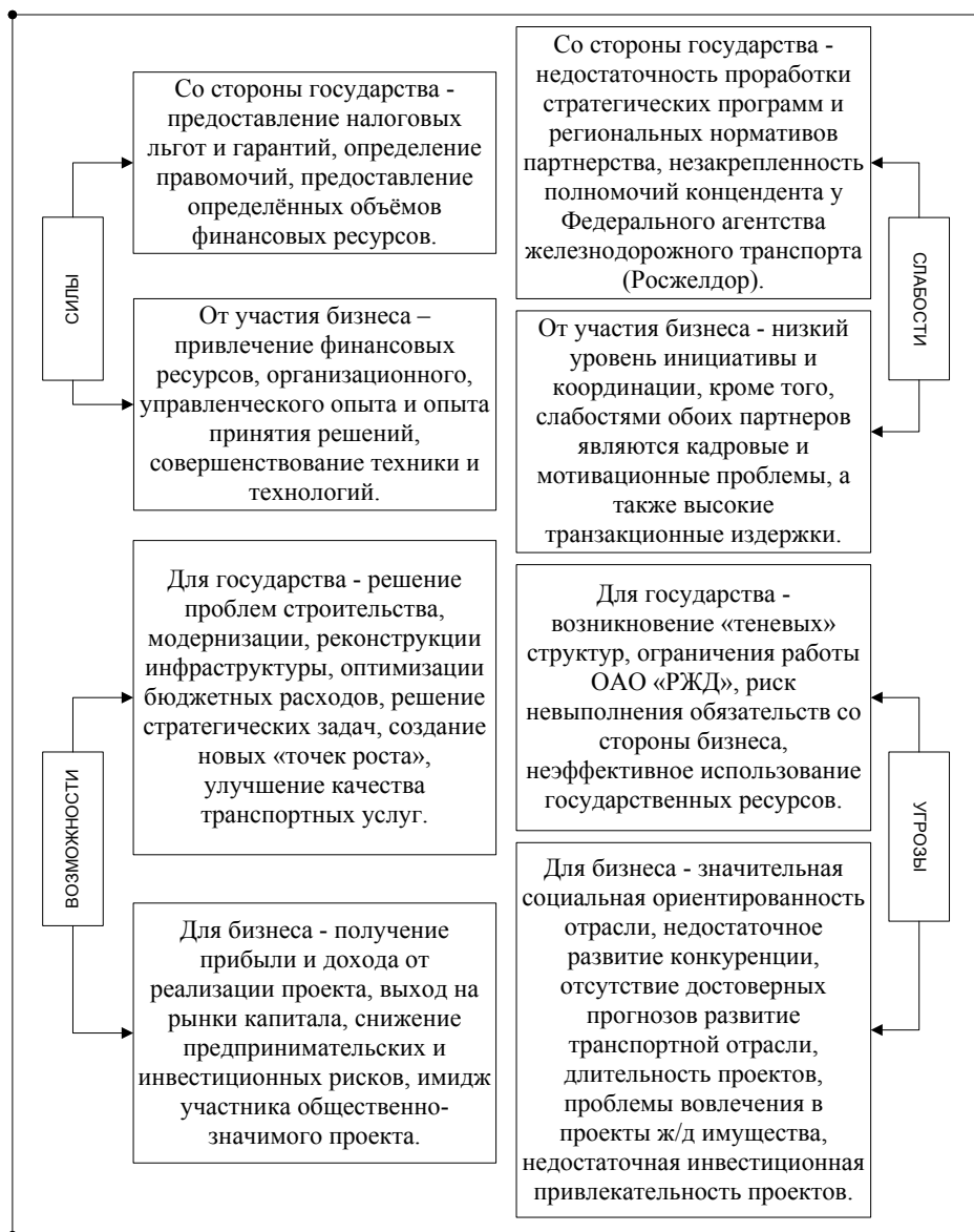
Рис. 2. Результаты SWOT-анализа реализации ГЧП в сфере ж/д услуг (составлено по данным [4])