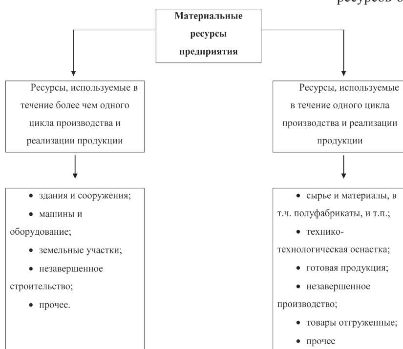
Рис. 1. Классификация материальных ресурсов предприятия

Прежде чем приступить к рассмотрению социально-экономических результатов ресурсосбережения материальных ресурсов, представляется целесообразным определить само понятие «ресурсосбережение», так как в имеющейся литературе наблюдается определенная несогласованность по поводу данной категории.