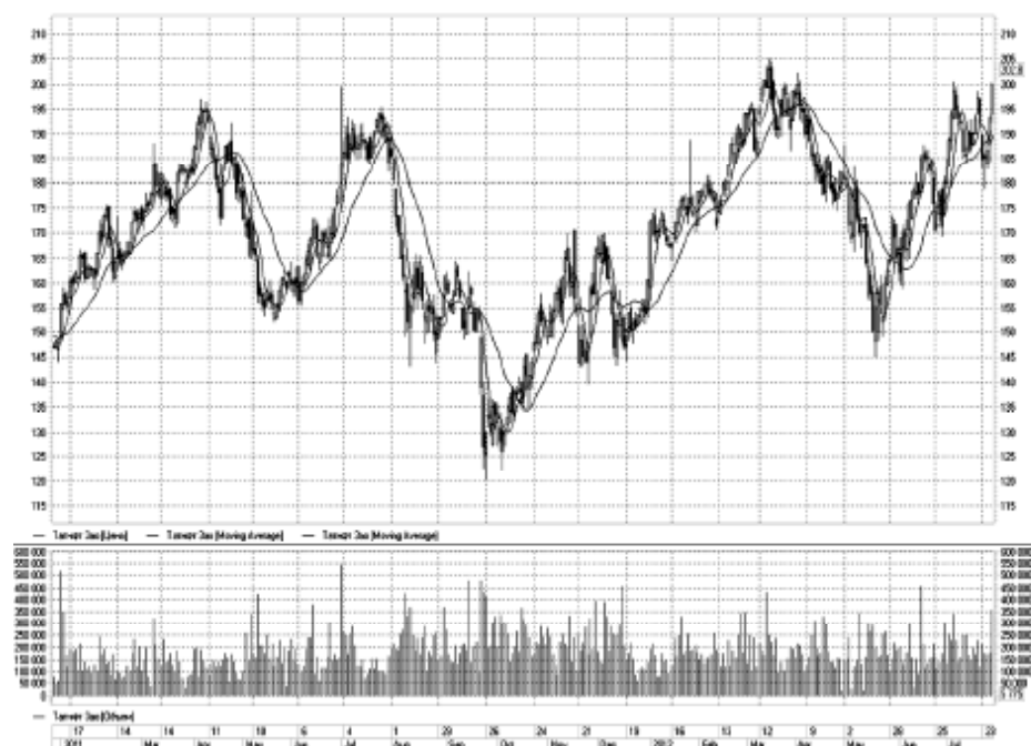
Рис. 1. График цены обыкновенных акций ОАО «Татнефть» в период с 11.01.2011 г. по 25.07.2012 г. [3]

Таким образом, наряду с традиционными стратегиями, формирование и применение инновационных торговых стратегий на региональных финансовых рынках в условиях развития рыночных отношений является одним из действенных методов и инструментов, повышающих эффективность хозяйствующего