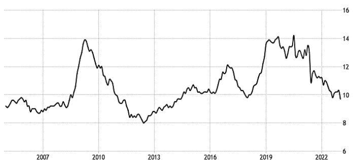
Рис. 2. Уровень безработицы в Турции 2005–2023 гг., % [6]