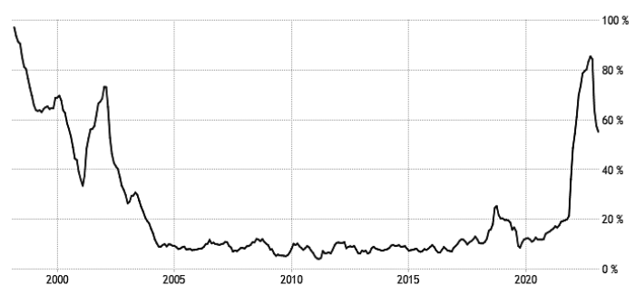
Рис. 1. Инфляция в Турции 1998–2023 гг., % [4]

Инвестиционный климат в стране, как и прежде, оставляет желать лучшего, так как приток прямых иностранных инвестиций остается незначительным. Необходимо отметить, что в Турции существует комплексный механизм стимулирования инвестиций, согласованный с Министерством промышленности и технологий, также государство предоставляет инвесторам такие возможности, как освобождение от НДС, снижение таможенных пошлин, инвестиционное пространство и т.п. Иностранные инвесторы пользуются такими же правами и обязанностями, что и местные инвесторы. Однако инвестиции в инфраструктуру распределяются неодинаково, и концентрируются они прежде всего