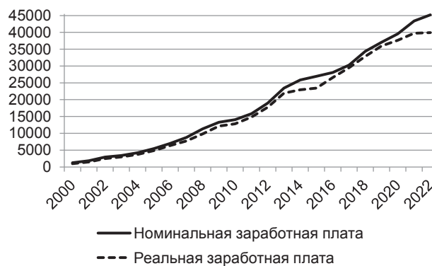
Рис. 3. Динамика номинальной заработной платы учителей среднего общего образования [4]

Так, по данным статистики [4], динамика номинальной оплаты труда педагогов выглядит положительной (рис. 3).