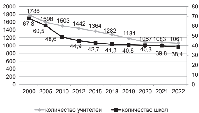
Рис. 1. Динамика изменения количества школ и учителей в РФ [1]

По данным Минпросвещения РФ, 76 % школьных учителей в России имеют ставку заработной платы ниже МРОТ. Выпускники педагогических вузов в таких условиях не идут работать в школы: по данным президента Российской академии образования О. Васильевой, учителями становятся не более 30 % тех, кто поступает на педагогические направления подготовки вузов [2].