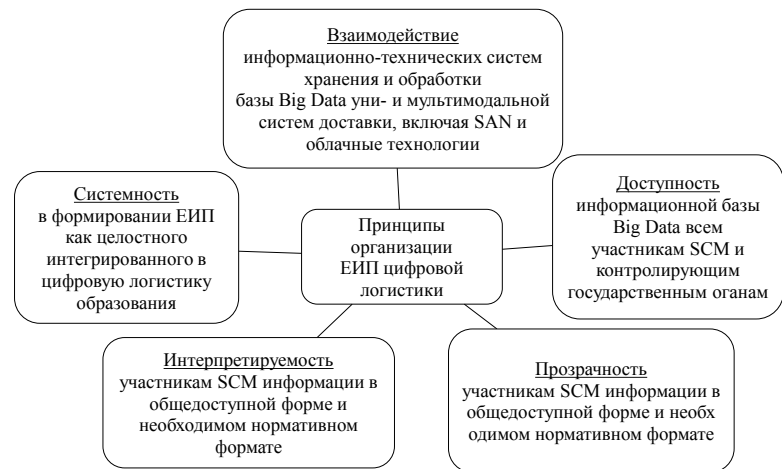
Рис. 2. Принципы организации ЕИП цифровых логистических систем

Целостная инфокоммуникационная система ИТС является частью когнитивной инфокоммуникационной системы цифрового управления в цепях поставок ( Digital SCM ) [1-3; 11]. И если информационный