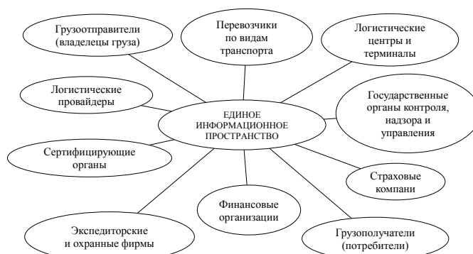
Рис. 1. Участники логистической системы, взаимодействующие в среде единого информационного пространства

Современная концепция создания ЕИП отдает преимущество применению инструментария Cloud Computing [5-8] и его прогрессивной формы, Block Chain [4; 10], на основе которого выстраивается управляющее взаимодействие участников цепей по-