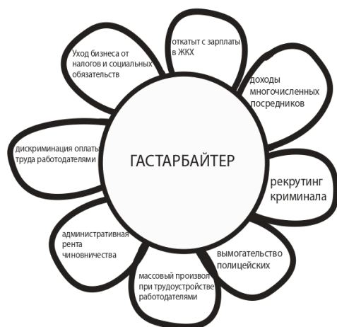
Рис. 2. Ромашка гастарбайтера (система коррупционных интересов вокруг трудовых мигрантов)

от неучтенного НДС не получено 1,3 трлн руб., не считая отчислений в фонды социального страхования и пенсионного обеспечения.