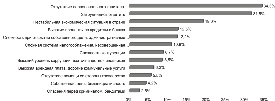
Рис. 4. Препятствия для открытия своего дела