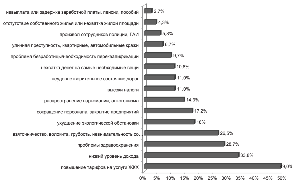
Рис. 3. Наиболее волнующие проблемы в настоящее время

Блок вопросов был посвящен трудностям предпринимательства в целом. По мнению 34,3 % опрошенных, «начать собственное дело» мешает отсут-