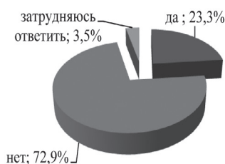
Рис. 1. Есть ли в классе ребята, которые тебя обижают?

Интересно, что проблема плохих отношений с учителями оказалась наименее распространенной, несмотря на появляющиеся в последнее время в средствах массовой информации различного рода репортажи о конфликтах между учителями и учениками. Таким образом, данная проблема на сегодняшний день стоит не так остро, как нам ее преподносят СМИ.