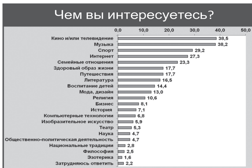
Рис. 1. Социологические исследования жителей г. Москвы

В 2012 г. Заокская Духовная Академия организовала докторскую программу по специализации «Доктор практической теологии» в области «Лидерства» в сфере духовного образования Евро-Азиатского региона, с участием зарубежных преподавателей из ведущего адвентистского на-