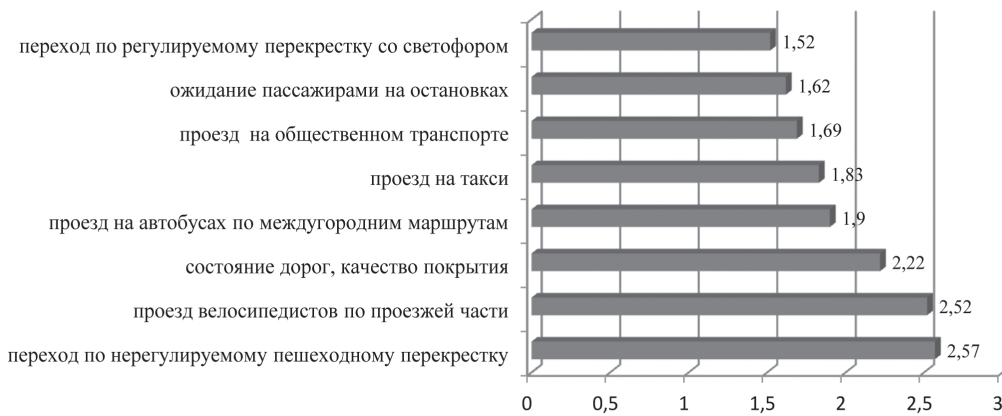
Рис. 3. Рейтинг основных опасностей на дороге

Большое значение в обеспечении безопасности на дорогах играет своевременное и должное обучение правилам дорожного движения. Данный вид обучения должен стать составной частью всего процесса социализации и в нем должны участвовать все ведущие агенты как макро-, так и микроуровня [4, с. 126-128; 5]. Особая роль принадлежит семье как институту воспроизводства культуры и воспитания подрастающих поколений [6; 7].