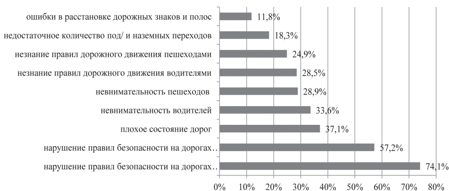
Рис. 2. Причины роста числа дорожно-транспортных происшествий