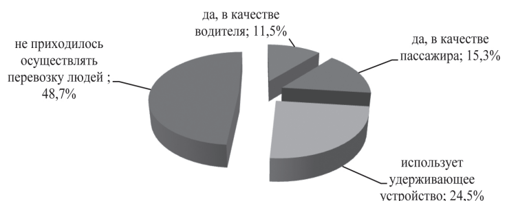
Рис. 4. Перевоз детей в автомашине

Исследование показало, что соблюдение правил дорожного движения и безопасность движения транспорта представляют собой основу в понимании горожанами транспортной безопасности в целом. Рейтинг различных ее аспектов позволяет утверждать, что горожане наиболее опасными считают переход по нерегулируемому пешеходному перекрестку и проезд велосипедистов по проезжей части. Средний уровень опасности присвоен ими